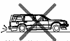
荷物の積みすぎによる 重量オーバー車